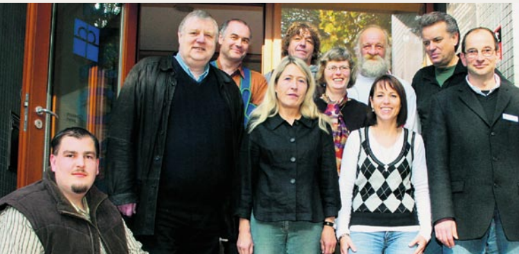
Das Team der Wohnungslosenhilfe

Wir bieten Menschen, die im Winter wohnungslos sind, unsere Unterstützung an. In einer Wohnung, die von der Stadt Elmshorn zur Verfügung gestellt wird, finden die betroffenen Menschen eine Bleibe – ein Bett, eine Waschgelegenheit, kurz: ein Dach über dem Kopf. Damit keiner erfriert. Das Winternotprogramm dauert von Oktober bis März.